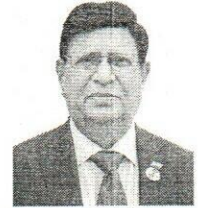
H.E. Dr. A. K. Abdul Momen, M.P.